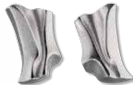
OHRSTECKER 925/- Sterlingsilber 145,- €