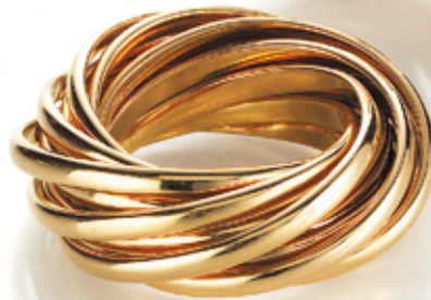
RING 585/- Gelbgold 2.650,- €