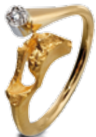
RING 750/- Gold, 1 Brillant 0,02 ct. W/vsi 743,- €