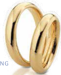
HERREN- UND DAMENRING 585/- Gelbgold, Paarpreis 899,- €