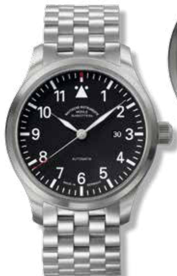
TERRASPORT II ø 40 mm 1.300,- €

Automatikwerk: Version Mühle mit Spechthalsregulierung, eigenem Rotor und charakteristischen Oberflächenveredelungen, Sekundenstopp. Gangreserve 38 Std., entspiegeltes Saphirglas. Boden mit Sichtfenster, verschraubte Krone. Wasserdicht bis 5 bar. Edstahlarmband mit Doppelfaltschließe oder Büffelleder mit Dornschnelle aus Edstahl. Stundenmarkierung und Zeiger mit Super-LumiNova belegt.