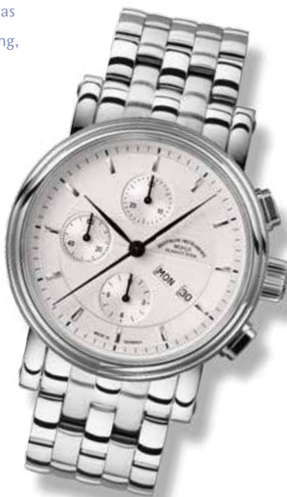
TEUTONIA II CHRONOGRAPH Ø 42 mm 3.200,- €

Uhrwerk: MU 9413, Automatik mit Spechthalsregulierung, Glashütter Dreiviertelplatine und charakteristischen Oberflächenveredelungen, Sekundenstopp. Schnellkorrektur für Datum und Wochentag. 48 h mit Gangreserve. Gehäuse: Edelstahl geschliffen/poliert. Gewölbtes und entspiegeltes Saphirglas. Boden mit Sichtfenster. Verschraubte Krone. Ø 42,0 mm; H 15,5 mm. Wasserdicht bis 10 bar. Krokoleder- oder Edelstahlband mit Doppelfaltschließe aus Edelstahl.