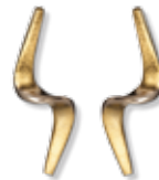
OHRSTECKER 585/- Gold 335,- €