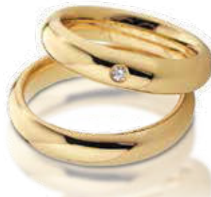
HERRENRING 585/- Gelbgold 929,- €