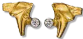
OHRSTECKER 750/- Gold, 2 Brillanten 0,02 ct. W/vsi 883,- €