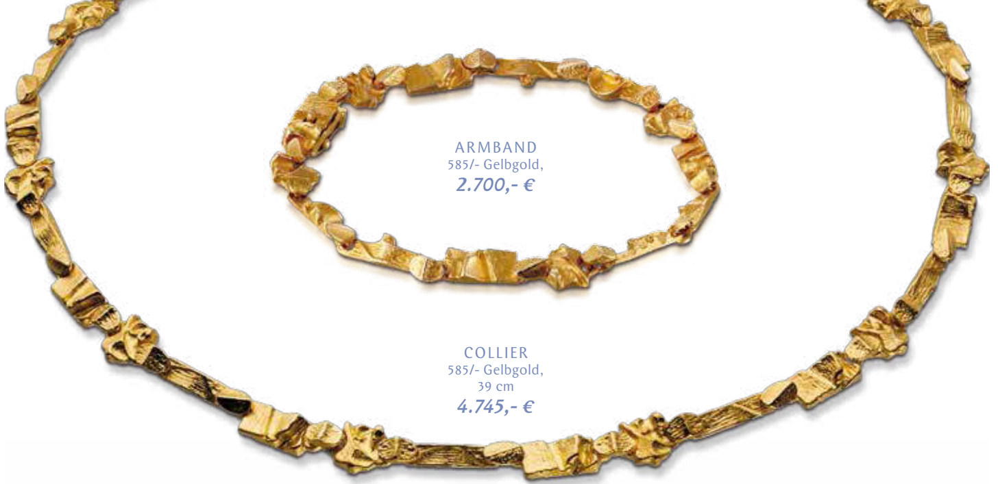
ARMBAND 585/- Gelbgold, 2.700,- €