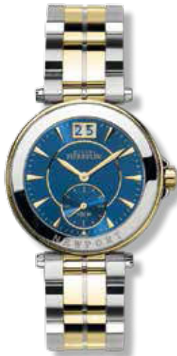
DAMENUHR Edelstahl, Titan mit 23 Karat Gelbgold PVD beschichtet, blaues Zifferblatt, ø 28 mm 779,- €