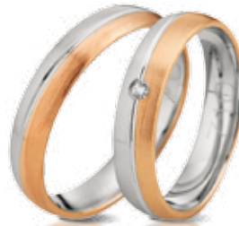
HERRENRING 585/- Rosé- und Weißgold 549,- €