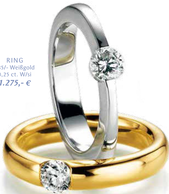
RING 585/- Weißgold 0,25 ct. W/si 1.275,- €