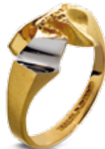
RING 585/- Gold 795,- €