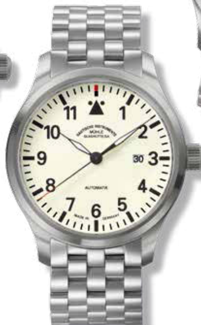
TERRASPORT I ø 44 mm 1.400,- €