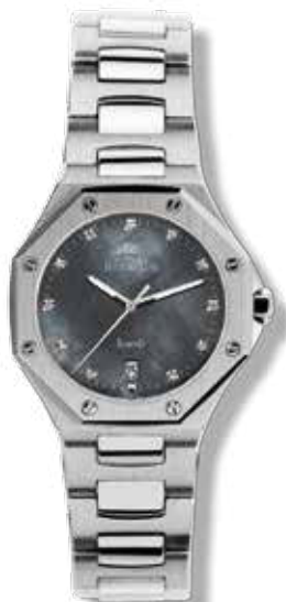
DAMENUHR STAHL Perlmutter-Zifferblatt mit 11 handgefassten Brillanten 0,06 Ct., ø 27,8 mm 799,- €

Sportliche Damen- und Herrenuhren mit Schweizer Quarzwerk, Datumanzeige, verschraubtem Gehäuseboden, Edelstahlarmband mit Doppelfaltschließe und seitlichen Drückern, entspiegeltem Saphirglas, wasserdicht bis 100 Meter.