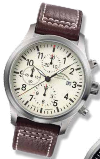
TERRASPORT I CHRONOGRAPH ø 44 mm 2.700,- €