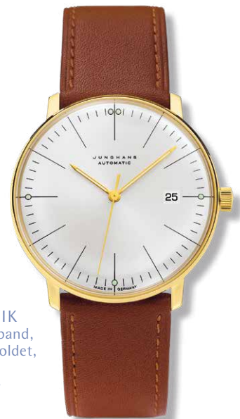
AUTOMATIK mit Kalbslederband, 10 Mikron vergoldet, ø 38 mm 955,- €