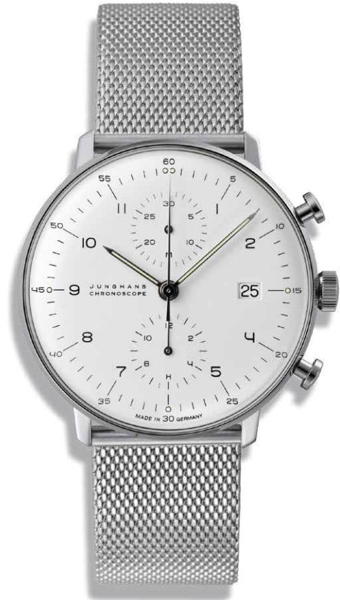
CHRONOSCOPE Automatikwerk J880.2 mit Milanaiseseband, ø 40 mm 1.695,- €