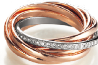
RING 750/- Roségold, Brillanten 0,38 ct. TW/vsi 3.190,- €

7 Ringe fügen sich zu einem Schmuckstück zusammen. Für jeden Tag einen Ring, der Brillantring ist der Sonntag.