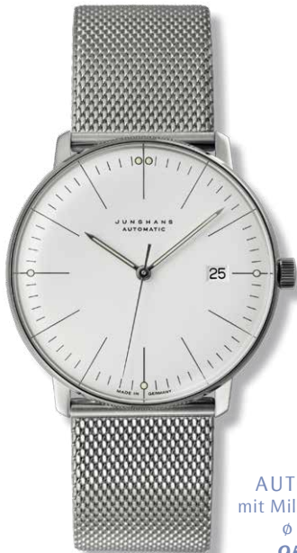
AUTOMATIK mit Milanaiseseband, ø 38 mm 955,- €