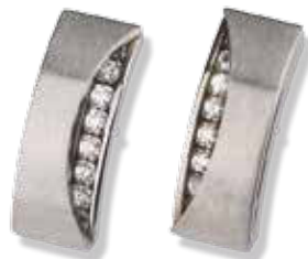
OHRSTECKER mit Zirkonia 129,- €