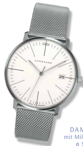
DAMENUHR mit Milanaiseband, Ø 32,7 mm 545,- €