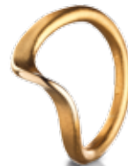
RING 750/- Gold 945,- €