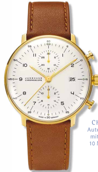
CHRONOSCOPE Automatikwerk J880.2 mit Kalbslederband, 10 Mikron vergoldet, ø 40 mm 1.695,- €