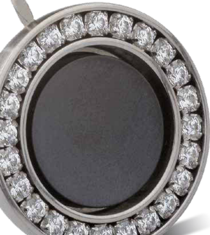
RING mit Zirkonia 124,- €