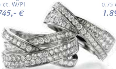
RING 585/- Weißgold 0,75 ct. W/PI 1.890,- €