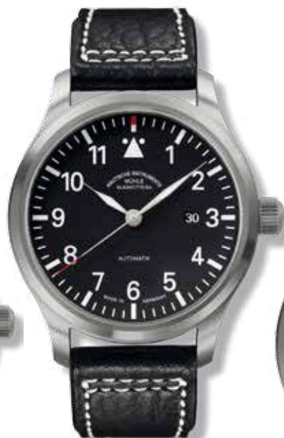
TERRASPORT I ø 44 mm 1.300,- €