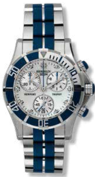
DAMENUHR- CHRONOGRAPH Edelstahl mit blauer Keramik, Diamant- Perlmutter-Zifferblatt, ø 35 mm 1.395,- €