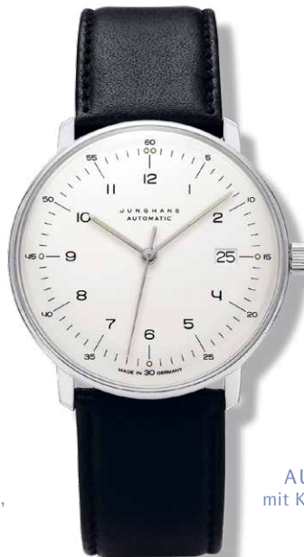
AUTOMATIK mit Kalbslederband, ø 38 mm 925,- €