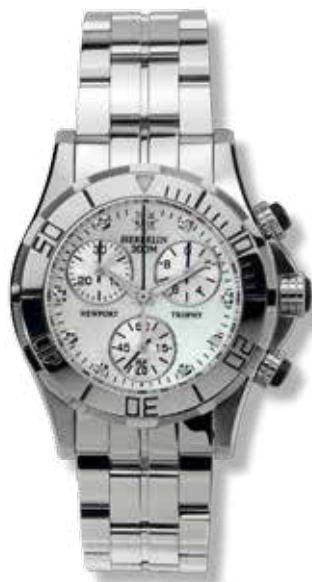
DAMENUHR- CHRONOGRAPH Edelstahl, Diamant- Perlmutter-Zifferblatt, ø 35 mm 1.195,- €

Französische Eleganz, gepaart mit Schweizer Präzision: Das ist die Erfolgsgeschichte von Michel Herbelin. Sportlichkeit mit Eleganz und Niveau strahlen die Modelle der Newport-Kollektion aus. Taucheruhren mit Quarzwerk, wasserdicht bis 300 Meter, Krone und Drücker verschraubt, Saphirglas.