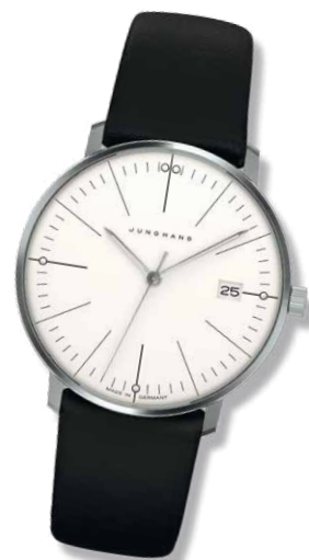
DAMENUHR mit Kalbslederband, Ø 32,7 mm 495,- €