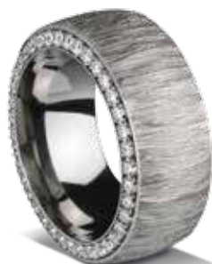
RING mit Zirkonia 104,- €