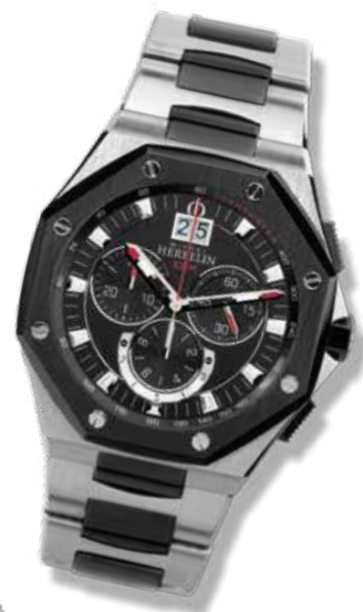
HERRENUHR- CHRONOGRAPH Chronograph mit 1/10 Sekunde, Minuten- und Stundenanzeige, Großdatum auf 12 Uhr, ø 43 mm 999,- €