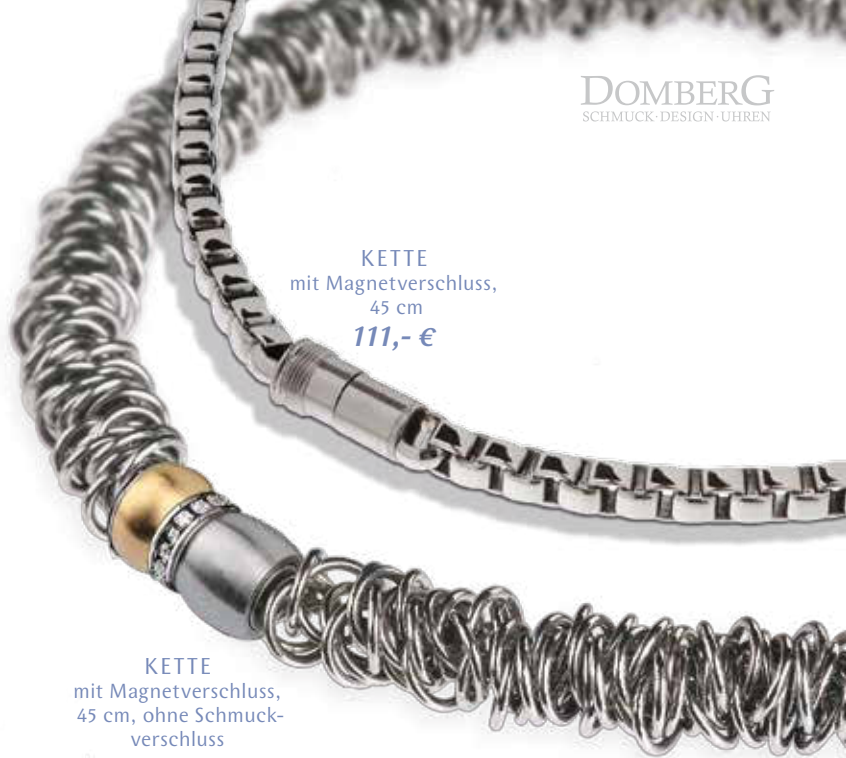
KETTE mit Magnetverschluss, 45 cm 111,- €