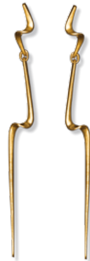
OHRSCHMUCK 750/- Gold 797,- €