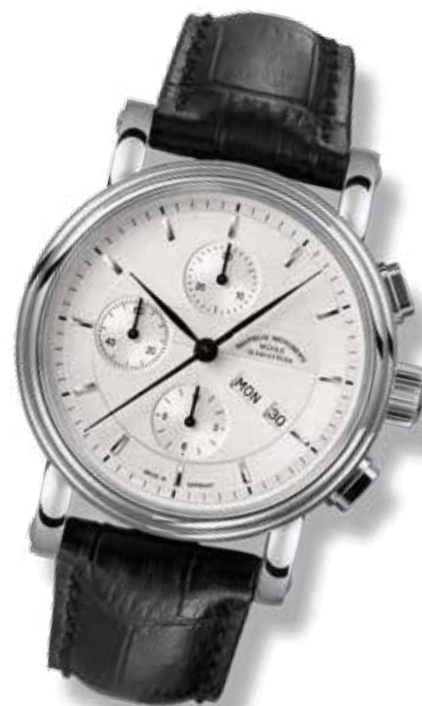
TEUTONIA II CHRONOGRAPH Ø 42 mm 3.100,- €