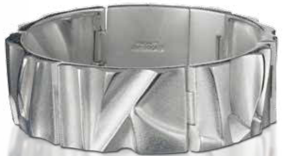
ARMREIFEN 925/- Sterlingsilber 1.465,- €