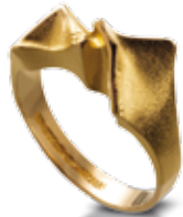
RING 585/- Gold 559,- €