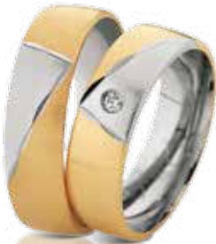
HERRENRING 585/- Gelb- und Weißgold 759,- €