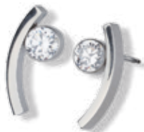
OHRSTECKER mit Zirkonia 53,- €