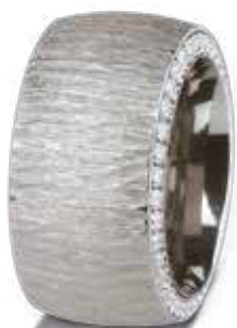
RING mit Zirkonia 109,- €