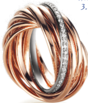
RING 585/- Roségold, Brillanten 0,41 ct. TW/vsi 3.840,- €

12 Ringe – einen für jeden Monat im Jahr. Der Brillant ausgefasste Ring ist für den Monat, in dem Sie Geburtstag haben.