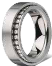
RING mit Zirkonia 109,- €