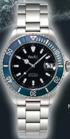
LADY NETTUNO ø 34,3 mm 648,- €