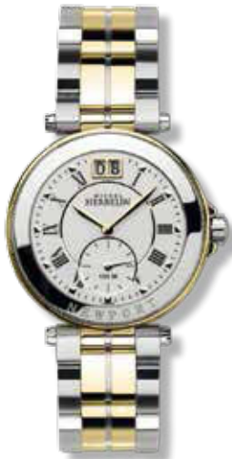
DAMENUHR Edelstahl, Titan mit 23 Karat Gelbgold PVD beschichtet, ø 28 mm 779,- €

Sportliche Damenuhren mit Quarzwerk, Großdatum, wasserdicht bis 100 Meter, verschraubte Krone, dezentrale Sekunde, Saphirglas.