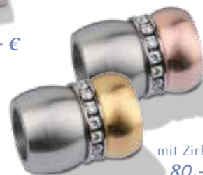
mit Zirkonia 80,- €