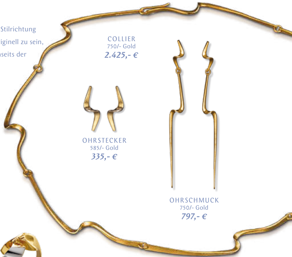
COLLIER 750/- Gold 2.425,- €