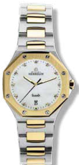
DAMENUHR BICOLOR Perlmutter-Zifferblatt mit 11 handgefassten Brillanten 0,06 Ct., ø 27,8 mm 999,- €