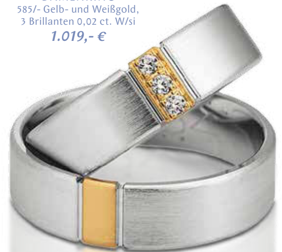
DAMENRING 585/- Gelb- und Weißgold, 3 Brillanten 0,02 ct. W/si 1.019,- €