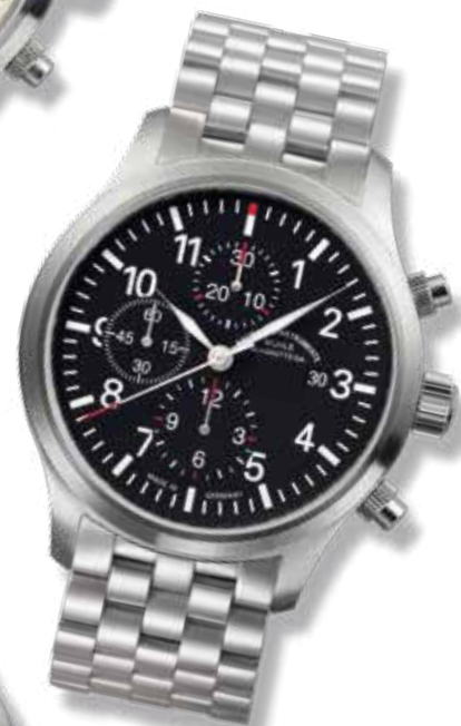
TERRASPORT I CHRONOGRAPH ø 44 mm 2.800,- €

NAUTISCHE INSTRUMENTE MÜHLE GLASHÜTTE/SA.