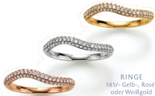
RINGE 585/- Gelb-, Rosé- oder Weißgold 0,60 ct. W/si je 1.250,- €