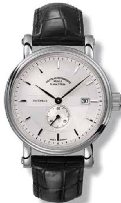
TEUTONIA II Ø 41 mm 1.900,- €

NAUTISCHE INSTRUMENTE MÜHLE GLASHÜTTE/SA.