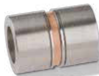
mit Zirkonia 80,- €

SCHMUCKVERSCHLÜSSE zur Verschönerung der Kette werden auf den Verschluss geschraubt.