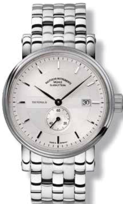
TEUTONIA II Ø 41 mm 2.000,- €