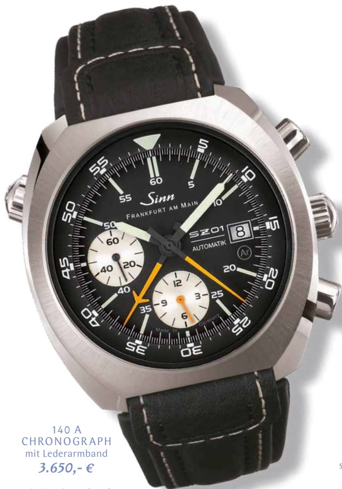
140 A CHRONOGRAPH mit Lederarmband 3.650,- €