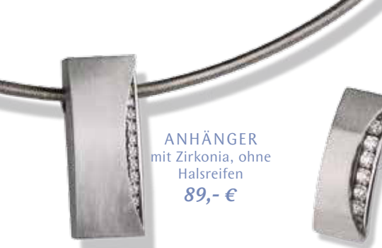
ANHÄNGER mit Zirkonia, ohne Halsreifen 89,- €