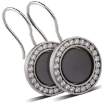
OHRSCHMUCK mit Zirkonia 164,- €