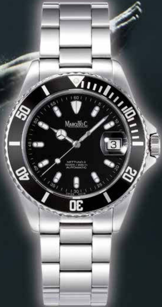
NETTUNO 3 ø 40 mm 648,- €