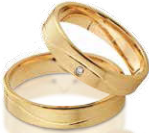
HERRENRING 585/- Gelbgold 559,- €