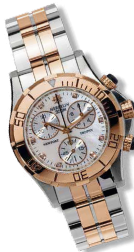
DAMENUHR- CHRONOGRAPH Edelstahl, Titan mit 23 Karat Roségold PVD beschichtet, Diamant- Perlmutter-Zifferblatt, ø 35 mm 1.395,- €