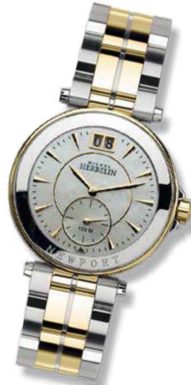
DAMENUHR Edelstahl, Titan mit 23 Karat Gelbgold PVD beschichtet, Perlmutt- Zifferblatt, ø 28 mm 779,- €